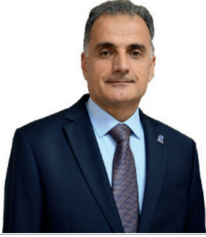
Prof. Dr. Hamza AL Sakarya Üniversitesi Rektörü

Üniversite olarak 2023-2024 Bahar yarıyılı geride bırakıyoruz. Araştırma Üniversitesi olma vizyonuyla çıktığımız bu yolda özellikle proje bazlı çalışmalarda önemli mesafeler kaydettik. Son olarak Sakarya Üniversitesi, Cumhuriyetimizin 100. Yılına Özel olarak açılan TÜBİTAK-1001 çağrısı kapsamında, 6 proje kabulü ile Türkiye birincisi olarak önemli bir başarı elde etti. Üniversitemizdeki araştırmacıların yüksek etki faktörlü dergilerde yayımladıkları makaleler, ulusal ve uluslararası düzeydeki akademik sıralamalarda üniversitemizin konumunu önemli ölçüde etkilemektedir. Üniversitemizin sıralamalardaki yerinin iyileştirilebilmesi, özellikle Web of Science gibi veri tabanında yüksek etki faktörüne sahip dergilerde yapılan yayınların sayısının artırılmasına bağlıdır. Bu kapsamda "Web of Science" indeksinde taranan, Q1, Q2 ve Q3 çeyreklik diliminde bulunan dergilerde üniversitemiz akademisyenlerinin 2024 yılı itibarıyla basılan makalelerine nakdi teşvik ödemesi yapılması kararlaştırıldı. Bu ve buna benzer desteklerle nitelikli yayın sayısının artacağı düşünülmektedir.